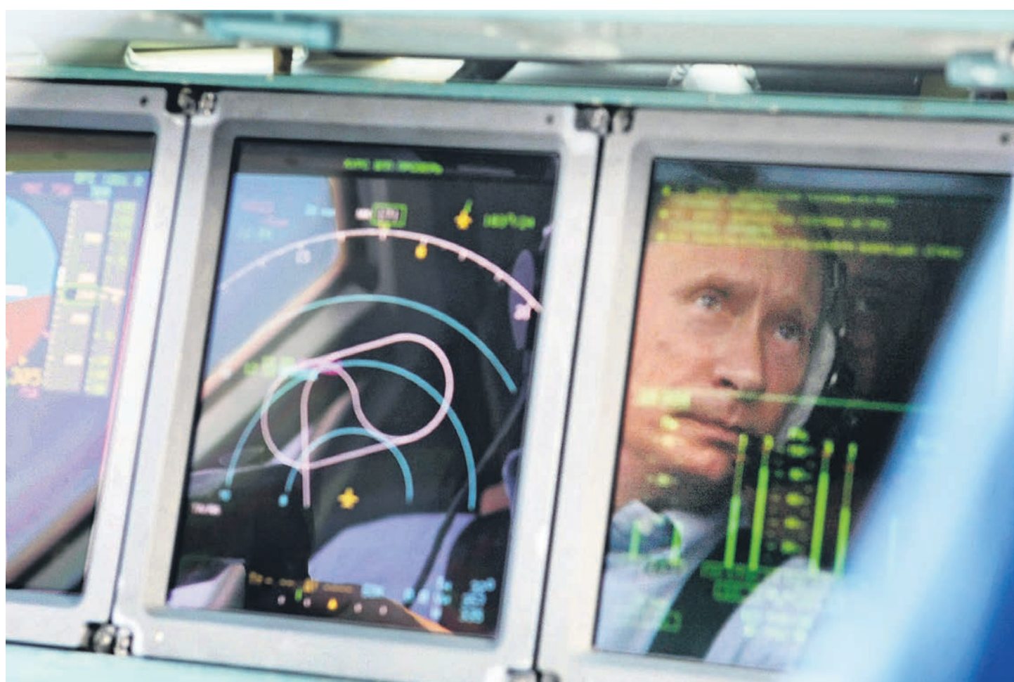
Владимир Путин заявил о присутствии в сфере военно-технического сотрудничества политических провокаций и экономических диверсий

Конкретных примеров Владимир Путин в открытой части заседания не привел, однако очевидно, что речь шла о действиях США и санкциях CAATSA, вступивших в силу 29 января и касающихся понятия «существенной сделки». Эти меры, как сообщал ранее «Ъ», направлены на ограничение оружейного экспорта, поскольку любая страна, сотруднича-