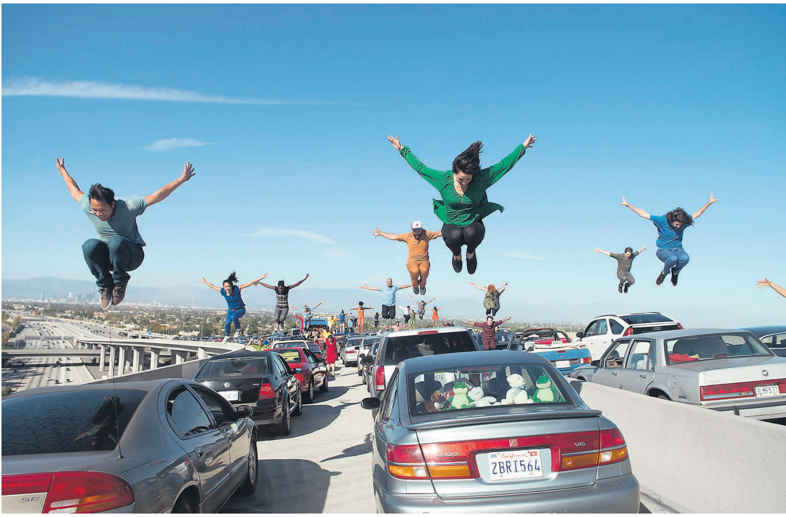
Французский след в «Ла-Ла Ленде» заметен уже в начальной танцевальной сцене, где кордебалет отплевывает в автомобильной пробке, — явная цитата из «Девушек из Рошфора» Жака Деми

Шазелл доказывает, что он настоящий, думающий режиссер, не только тем, как элегантно монтирует и разводит мизансцену, но и тем, как справляется с самым проблемным звеном проекта — ролью Гослинга. Этот актер с замороженным лицом мимикой нравится многим девушкам, но в общем-то играет «психологично» не без труда. Тут на подмогу пришло его природное чувство ритма и даже некоторый эстрадный опыт. Что касается Эммы Стоун,