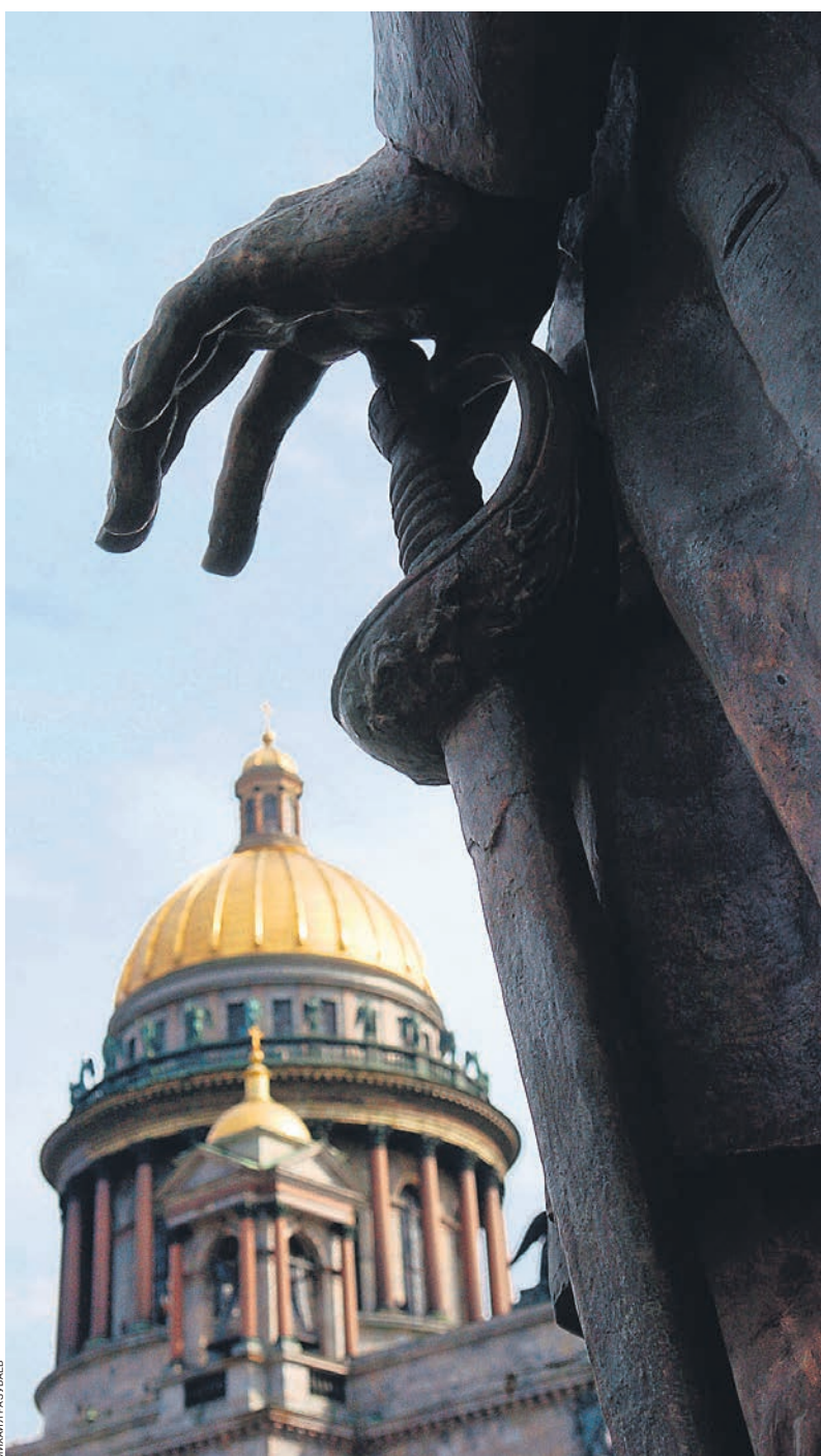
Переход Исаакиевского собора из рук светских властей в церковные обещают сделать постепенным

Напомним, в первый раз с просьбой передать Исаакиевский собор церкви в безвозмездное пользование Санкт-Петербургская митрополия обратилась к городским властям летом 2015 года. Обращение церкви вызвало протест со стороны культурного сообщества и оппозиционных депутатов петербургского парламента, которые безуспешно пытались вывести вопрос на общегородской референ-