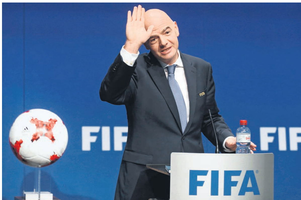
Увеличение числа команд — участников чемпионата мира с 32 до 48 Джанни Инфантино может считать своей первой победой на посту президента FIFA.

Укрупняя чемпионат мира, FIFA увеличит квалификационные квоты не только для Европы и Южной Америки, где гораздо больше, чем предусмотрено ими, сильных, имеющих в составе суперзвезд сборных, но и для других региональных конфедераций — североамериканской (CONCACAF), азиатской (AFC), африканской (CAF), а также стран Океании (OFC). Причем предполагается, что если европейская квота бу-