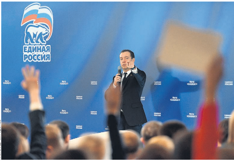
Дмитрий Медведев не собирается лично участвовать в дебатах, но мастер-класс для однопартийцев провел с удовольствием

Накануне единороссы проработали несколько тем для беседы с председателем, но, пожалуй, это была первая подобная «живая» встреча, когда Дмитрий Медведев абсолютно самостоятельно «вел» зал. Было видно, что он получал от этого удовольствие и даже несколько раз подбрасывал микрофон. Например, председатель столкнулся с несколькими навязчивыми активистами, которые на протяжении двух дней задавали вопросы каждому из выступавших на сцене. Один из них предложил создать в будущей думе новый комитет для инициатив: в нем могли бы работать «универсальные депутаты».