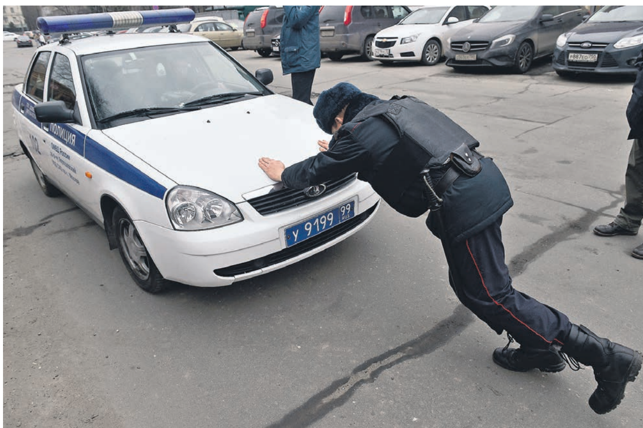
Независимые поставщики считают, что «Роснефти» не хватит мощностей для эффективного обеспечения топливом всех полицейских

Как стало известно, «Б», в правительстве готовят проект распоряжения, дающий «Роснефти» статус единственного продавца топлива для МВД. Опасаясь лишиться рынка, независимые поставщики пожаловались премьеру Дмитрию Медведеву, в ФАС, Минэкономике и Счетную палату. По их мнению, для обеспечения всех структур МВД «Роснефти» придется закупать топливо на рынке, что приведет к росту цены и расходов бюджета. В ФАС обещали проверить жалобу, а в Минэкономике и так считают, что давать статус единственного поставщика на рынках с развитой конкуренцией в принципе не следует.