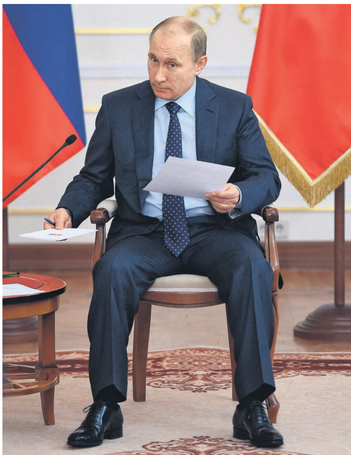
Владимир Путин пришел на встречу с интернет-стартаперами не с планшетом, а с листочками бумаги, хотя некоторые системные программисты на встрече уже праздновали полную победу над ней.

Российский президент, таким образом, не отделяет себя от фонда, а значит, и от всего интернет-сообщества, активным членом которого и даже, риску сказать, пользователем намерен быть: в конце концов, пользоваться интернет-аудиоторию (или хотя бы не игнориро-