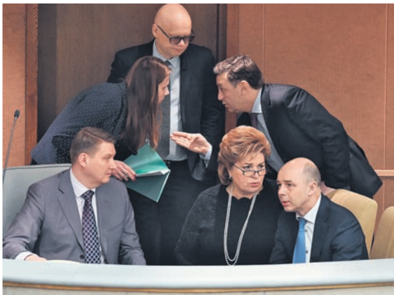
Претензии депутатов к новой версии бюджета-2015 встревожили представителей правительства, но не помешали ее одобрению.

Из трех десятков думских комитетов поправки не поддержали лишь два — по науке и по региональной политике. Отдельное «нет» в своем заключении сказала Федерация независимых профсоюзов России. Выступивший с содокладом глава профильного комитета ГД по бюджету и налогам Андрей Макаров оспорил базовый посыл Антона Силуанова, связавшего проблемы госказначейства с внешними шоками, реагировать на которые надо бюджетной консолидацией. «В большей степени проблема в том, что наша экономическая модель себя исчерпала», — заявил депутат. На системный же кризис, по его словам, надо реагировать совершенно противоположным образом — стимулированием бюджетных инвестиций. Нынешние антикризисные поправки Минфина, по его словам, это решение синопических проблем, программы структурных изменений они не содержат. Впрочем, ответил сам себе Андрей Макаров, это не означает, что поправки принимать не следует — хотя бы потому, что