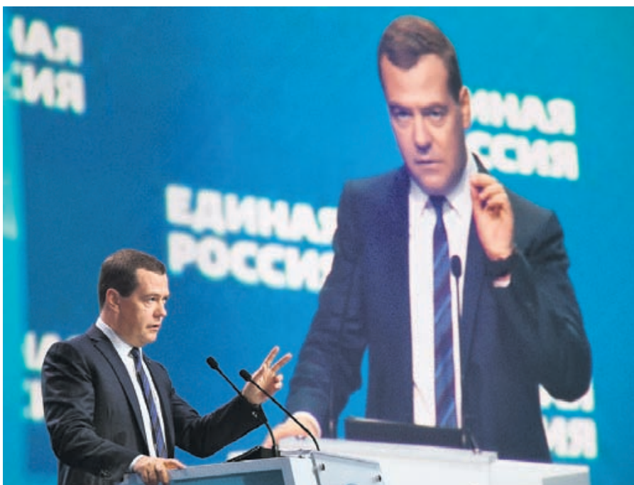
Премьер-министр Дмитрий Медведев на Всероссийском форуме социальных работников в Ярославле пообещал, что на период кризиса государство включит усиленный режим соцзащиты.

Выступление в Ярославле на прошедшем в Ярославле Всероссийском форуме соучастников Дмитрий Медведев начал с напоминания о том, что Россия по Конституции социальное государство и особенно тщательно оно должно исполнять свои обязанности перед населением именно в сложные периоды. Пример такого исполнения премьер-министр сразу же продемонстрировал. В обновленном бюджете 2015 года, который вчера был принят Госдумой в первом чтении (см. материал на стр. 1), из соображений экономии обнулены расходы федерального бюджета на поддержку социальных ориентированных НКО (в 2014 году они составляли около 1 млрд руб.). Выступая на форуме, Дмитрий Медведев заявил, что «ситуацию нужно поправить», и пообещал дать соответствующее поручение Минфину.