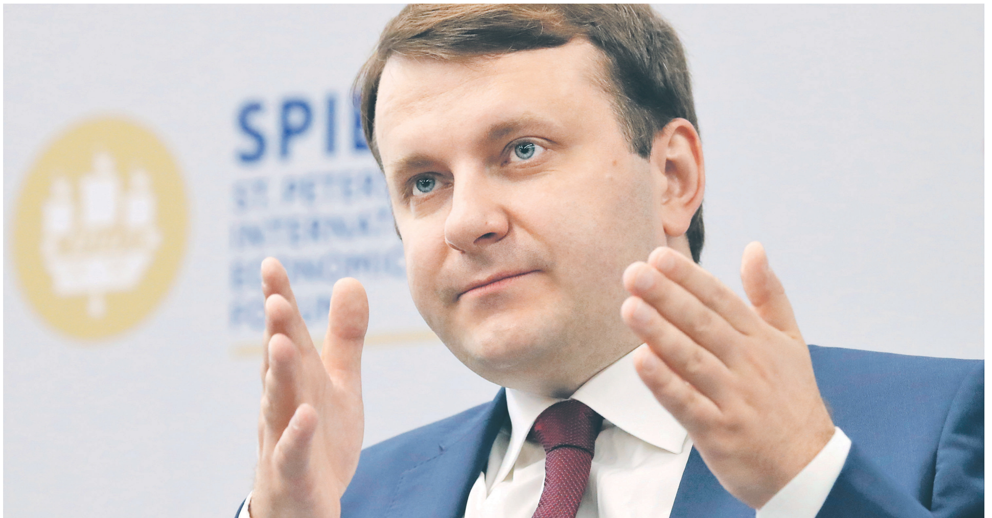
Главное опасение, которое власти высказали на ПМЭФ-2019, касалось закрепитованности населения. Глава Минэкономразвития Максим Орешкин отметил, что при нынешних темпах роста потребкредитования экономика может перейти к падению