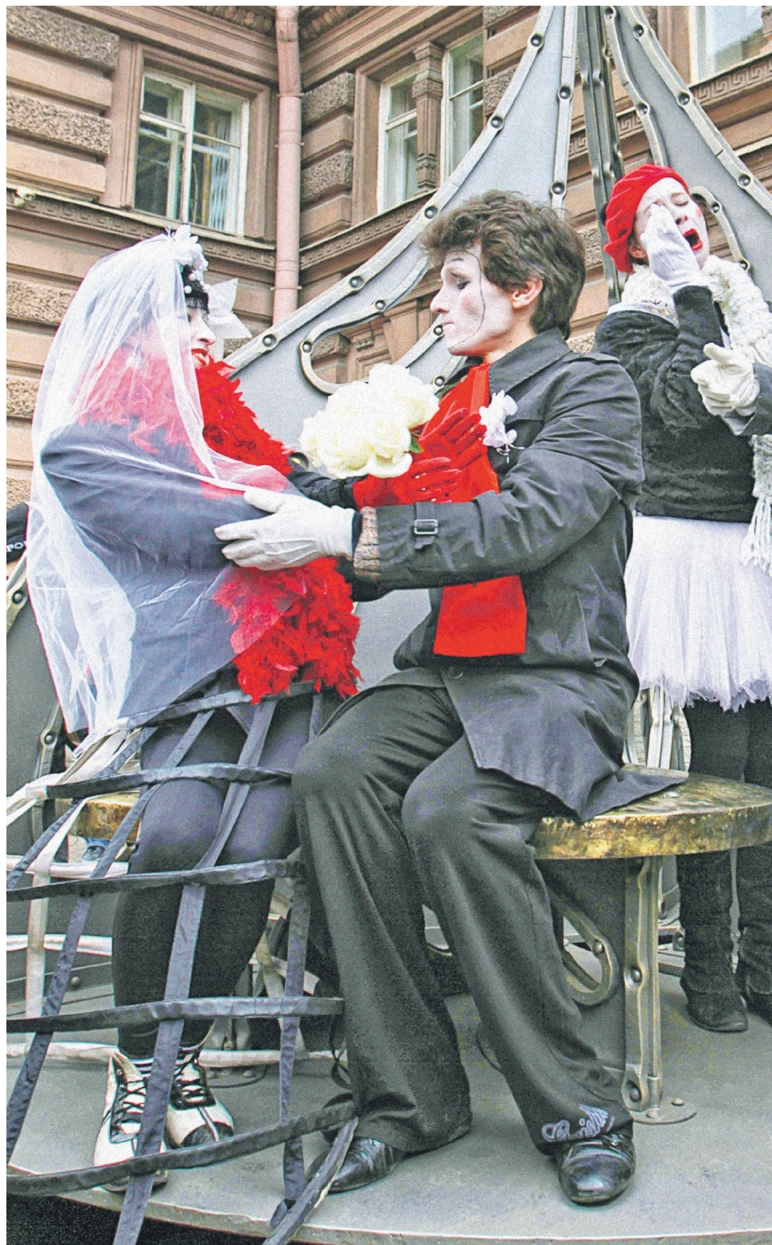
Как женились и развелись россияне

→ Браки сейчас заключаются среди малочисленных поколений, родившихся в 1990-е годы, поэтому неудивительно, что общий коэффициент брачности снижается, поясняет эксперт