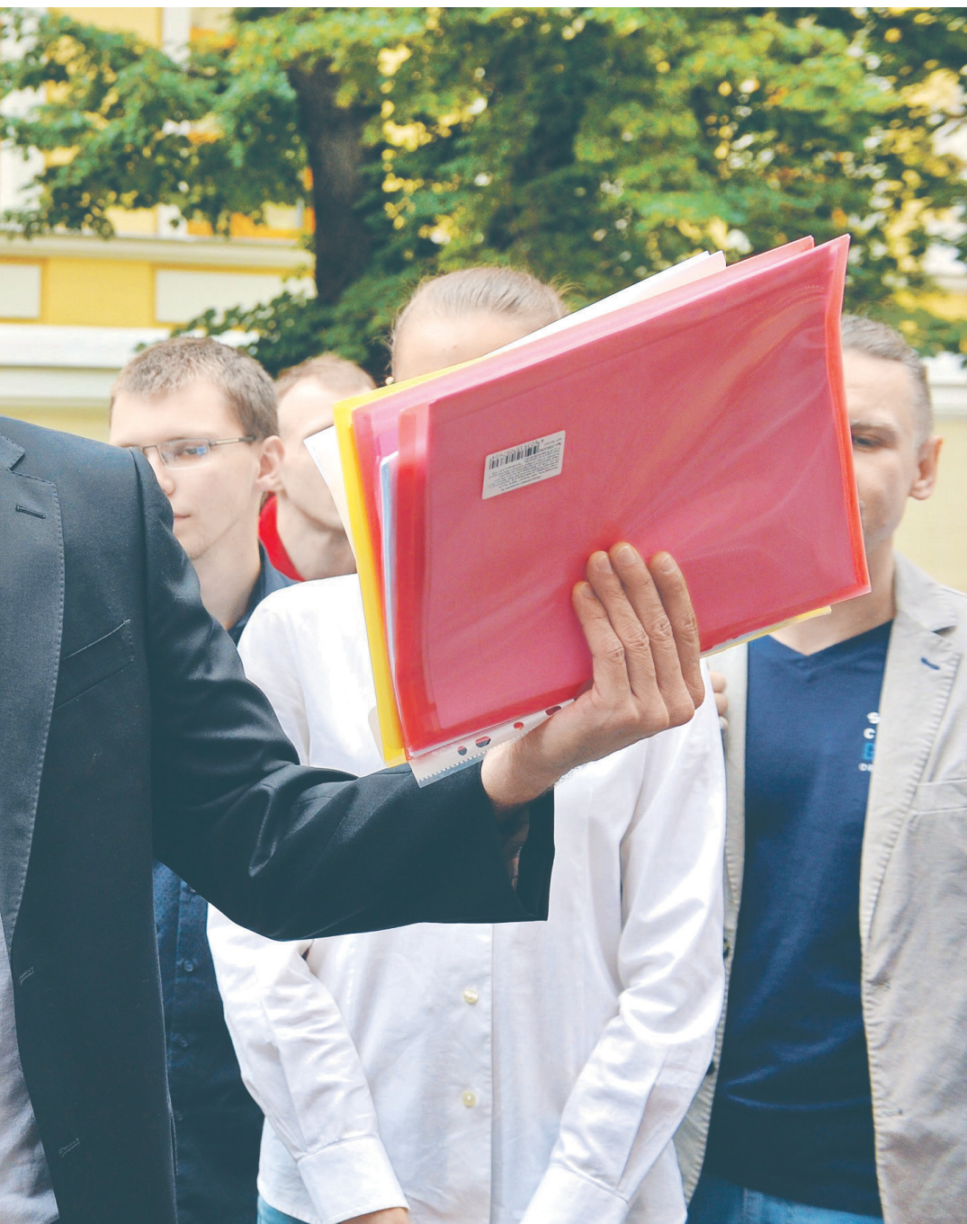
← Экс-депутат Госдумы Дмитрий Гудков собрал достаточное количество подписей для регистрации кандидатом, несмотря на трудности в процессе кампании