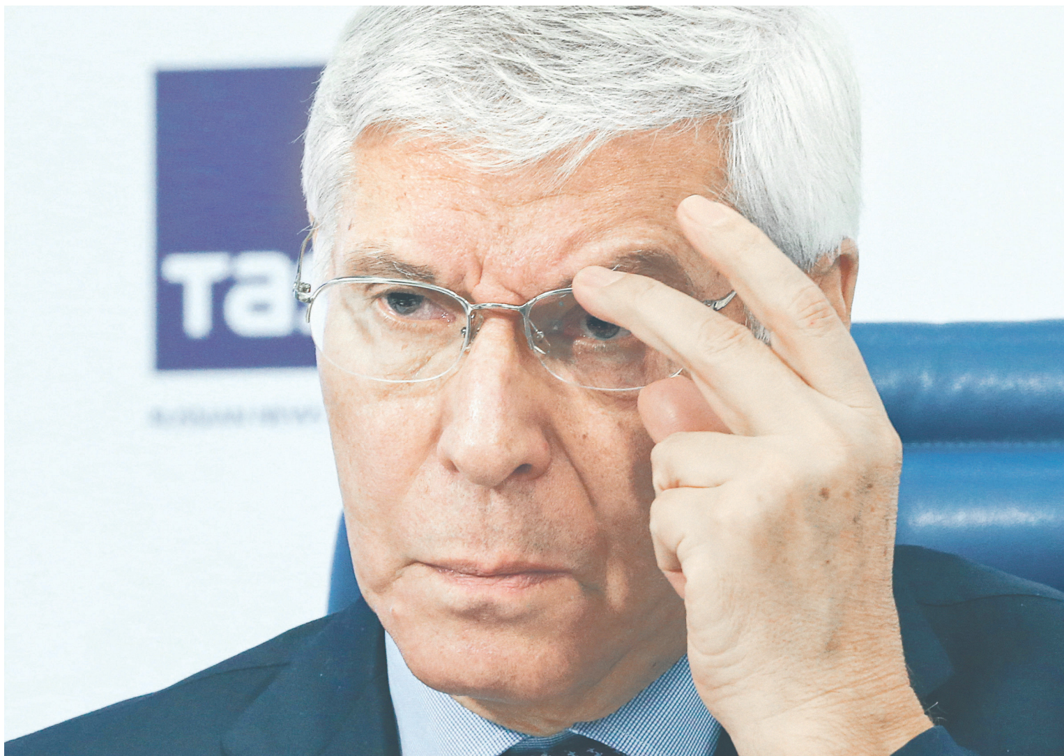
Президент Российского топливного союза Евгений Аркуша уверен: только создание конкуренции между производителями нефтепродуктов стабилизирует топливный рынок Дальнего Востока