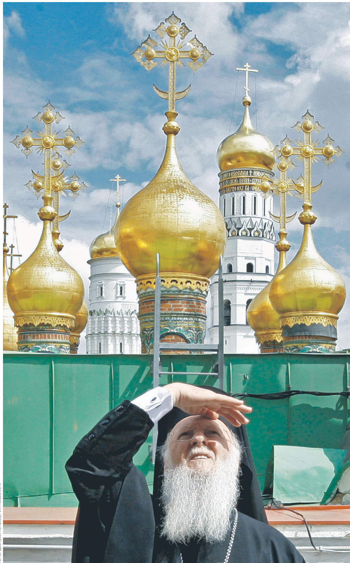
Патриарх Константинопольский Варфоломей, по утверждению украинских политиков, уже принял решение о даровании Украинской церкви самостоятельности

Кирилл и Варфоломей видятся не часто: их предыдущая встреча состоялась два года назад в швейцарском Шамбези на собрании предстоятелей автокефальных православных церквей. До этого они встречались в марте 2014 года на таком же мероприятии в Стамбуле. Судя по официальным сооб-