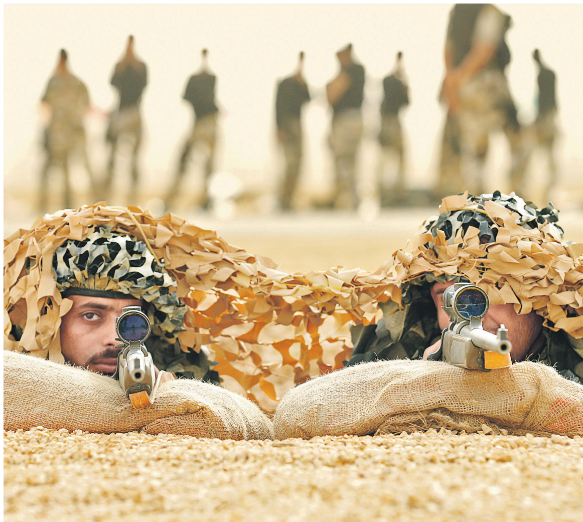
Бойцы спецназа Саудовской Аравии во время тренировки на западе Эр-Рияда