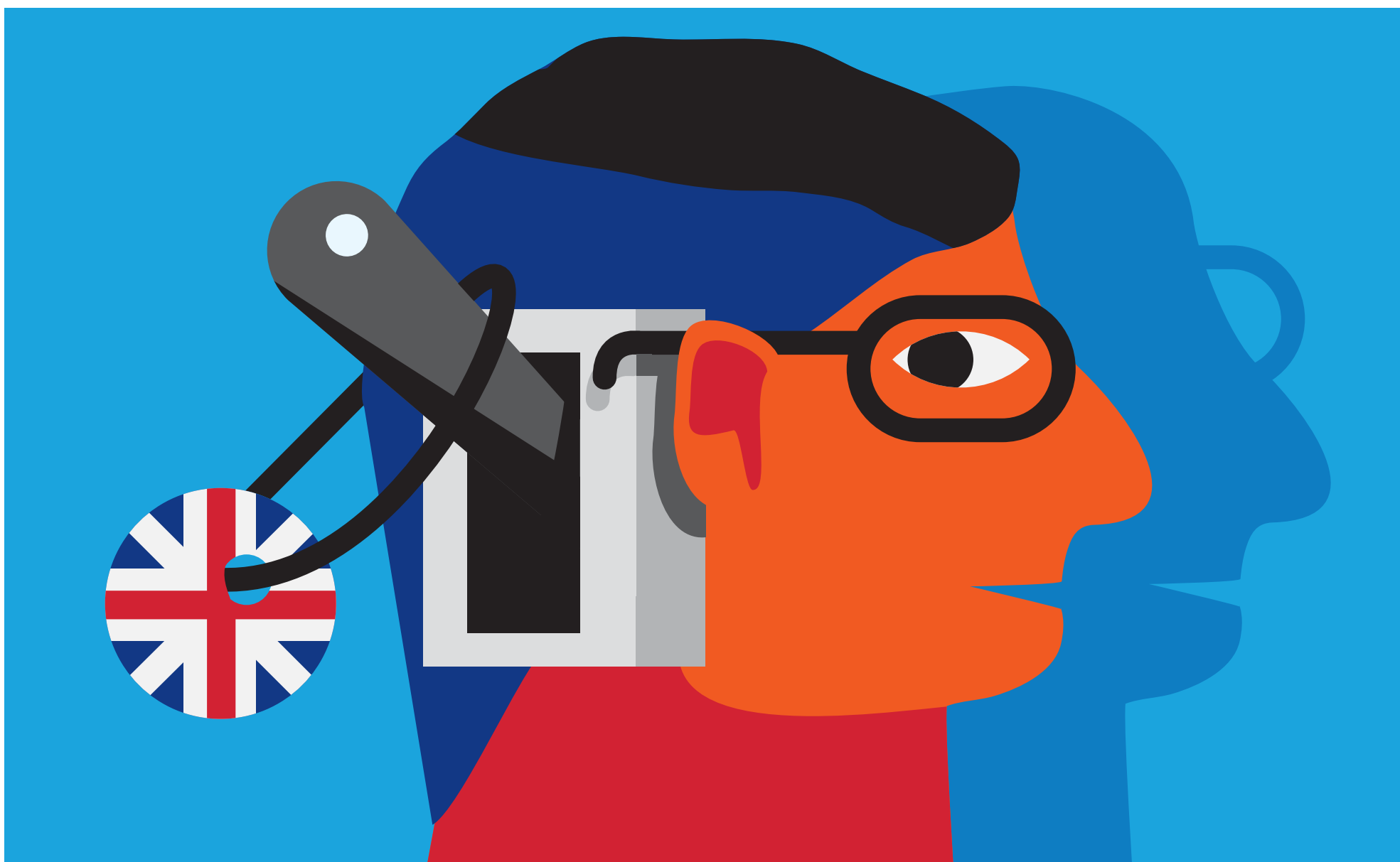
Иллюстрация: Тим Яржомбек для РБК