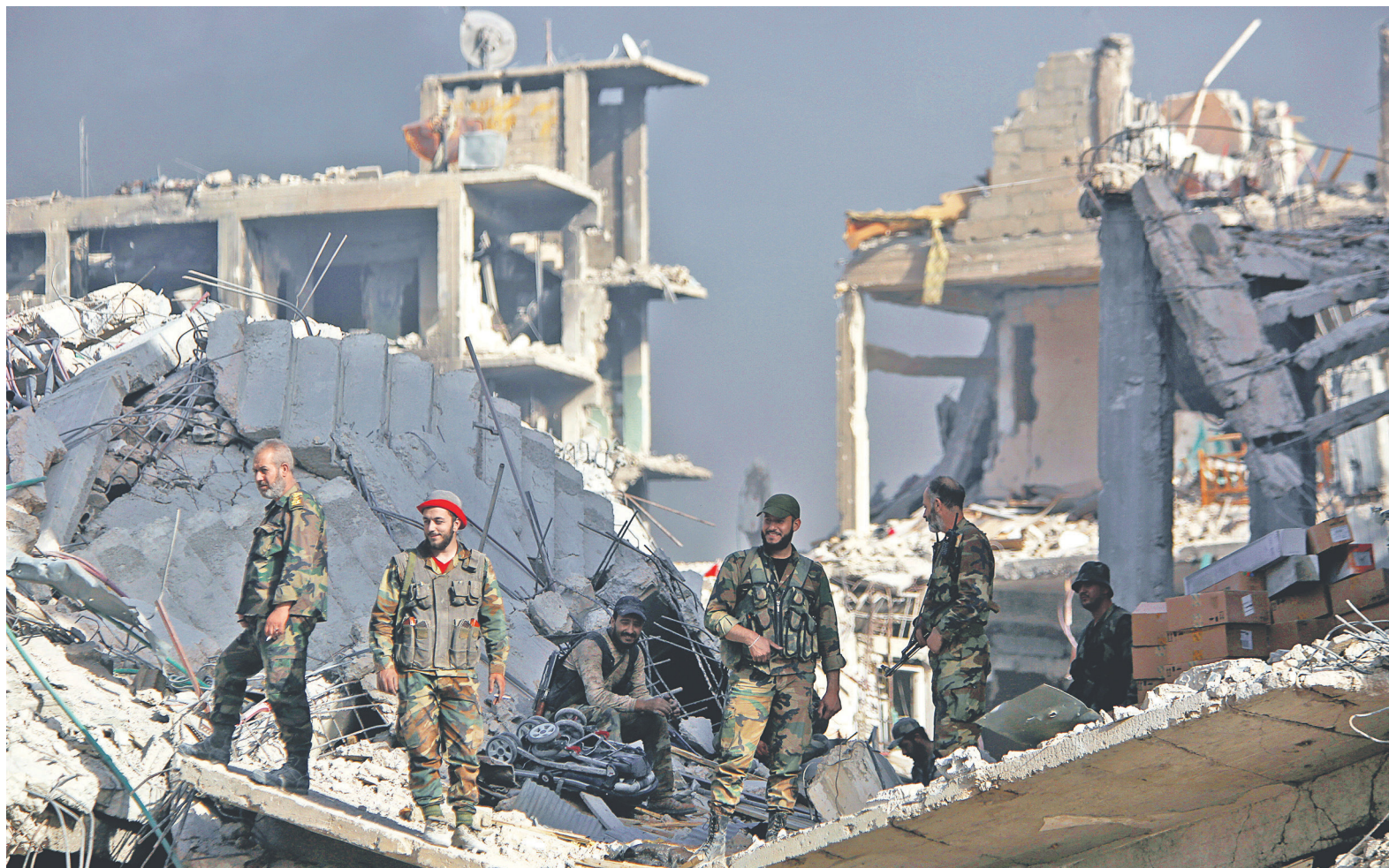
Правительственная армия Сирии (на фото) начала боевые действия на юге страны 23 июня, уже через день под ее контроль перешли 12 населенных пунктов

Из четырех зон деэскалации в Сирии, созданных в 2017 году при посредничестве России, Турции и Ирана, сегодня действуют только две: одна — на юго-западе Сирии, другая — в провинции Идлиб и частях соседних провинций Алеппо, Латакия и Хама. Остальные две зоны (в Восточной Гуте и к северу от Хомса) перешли в этом году под контроль сирийской армии. В зонах деэскалации огонь можно вести только по представителям террористических группировок, признанных таковыми Советом Безопасности ООН.