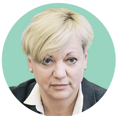
Валерия Гонтарева, глава украинского Нацбанка