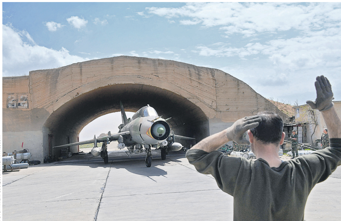
По поводу оценки ракетного удара по авиабазе Шайрат мнения сирийской оппозиции разделились: нашлись и сторонники, и противники действий США

Поддерживаемые Россией оппозиционные группировки, наоборот, осудили действия и позицию США. Требования об у-