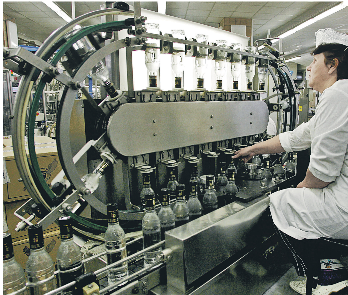
По данным компании Nielsen, в декабре 2016 — январе 2017 года продажи основного портфеля брендов «Статус-групп» составляли порядка 10% водочного рынка, «Кристалл-Лефортово» — более 7%