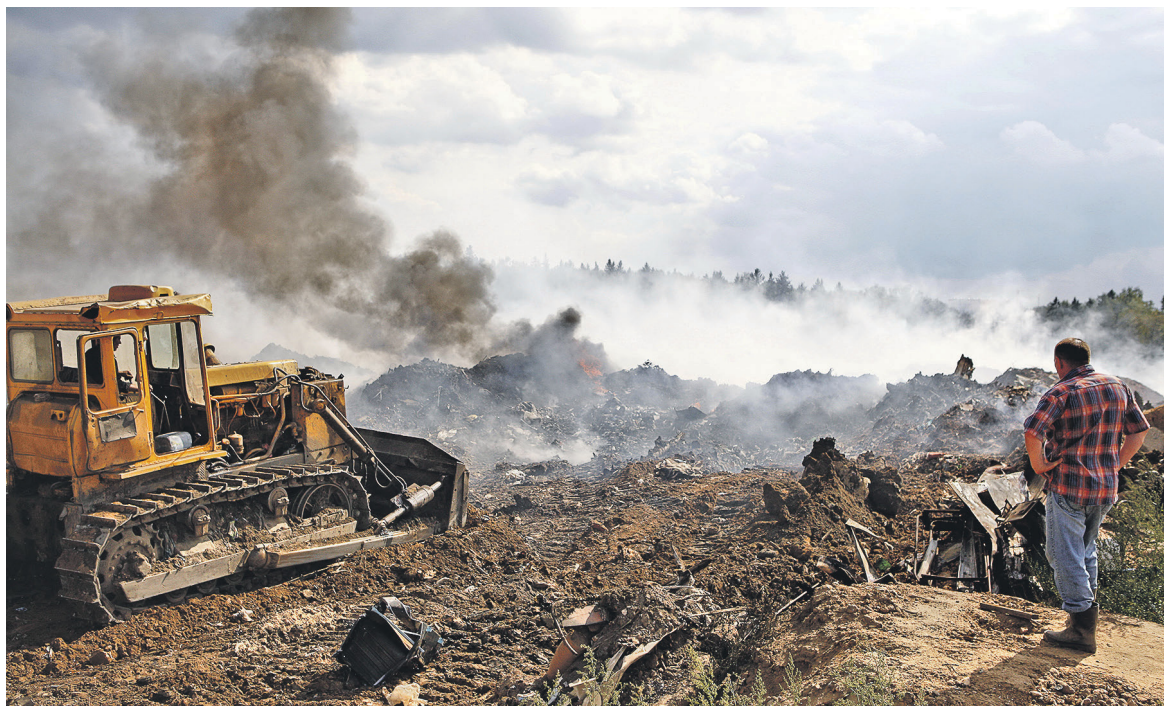
Открыть новый полигон «Малинки» было решено, после того как подмосковные чиновники объявили о планах закрыть в ближайшие годы большинство полигонов на территории области. На фото: пожар на свалке в Щелковском районе

«Земельный участок оставался в аренде у подольского предприятия до начала 2016 года, когда полигон был закрыт в связи с достижением проектных показателей по наполнению в 1,4 млн т отходов», — рассказал РБК представитель отдела по ЖКХ администрации Краснопахорского.