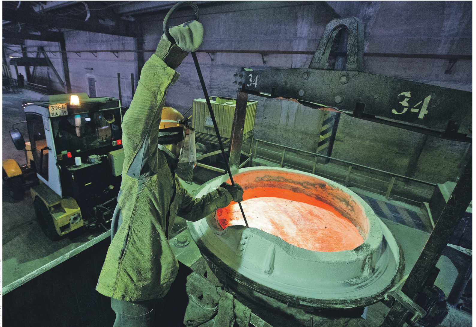
В ходе IPO инвесторам может быть продано от 12,5 до 16,5% группы En+, в состав которой входит производитель алюминия «Русал»

Главный инвестор En+ в ходе IPO AnAn Group владеет 63,8% в AnAn International, зарегистрированной на Бермудских островах. До сентября 2017 года она называлась SEFC International Ltd. Это международное подразделение китайской трейдинговой группы SEFC, которая в сентябре 2017 года договорилась о покупке 14,16% в российской «Роснефти». Сейчас