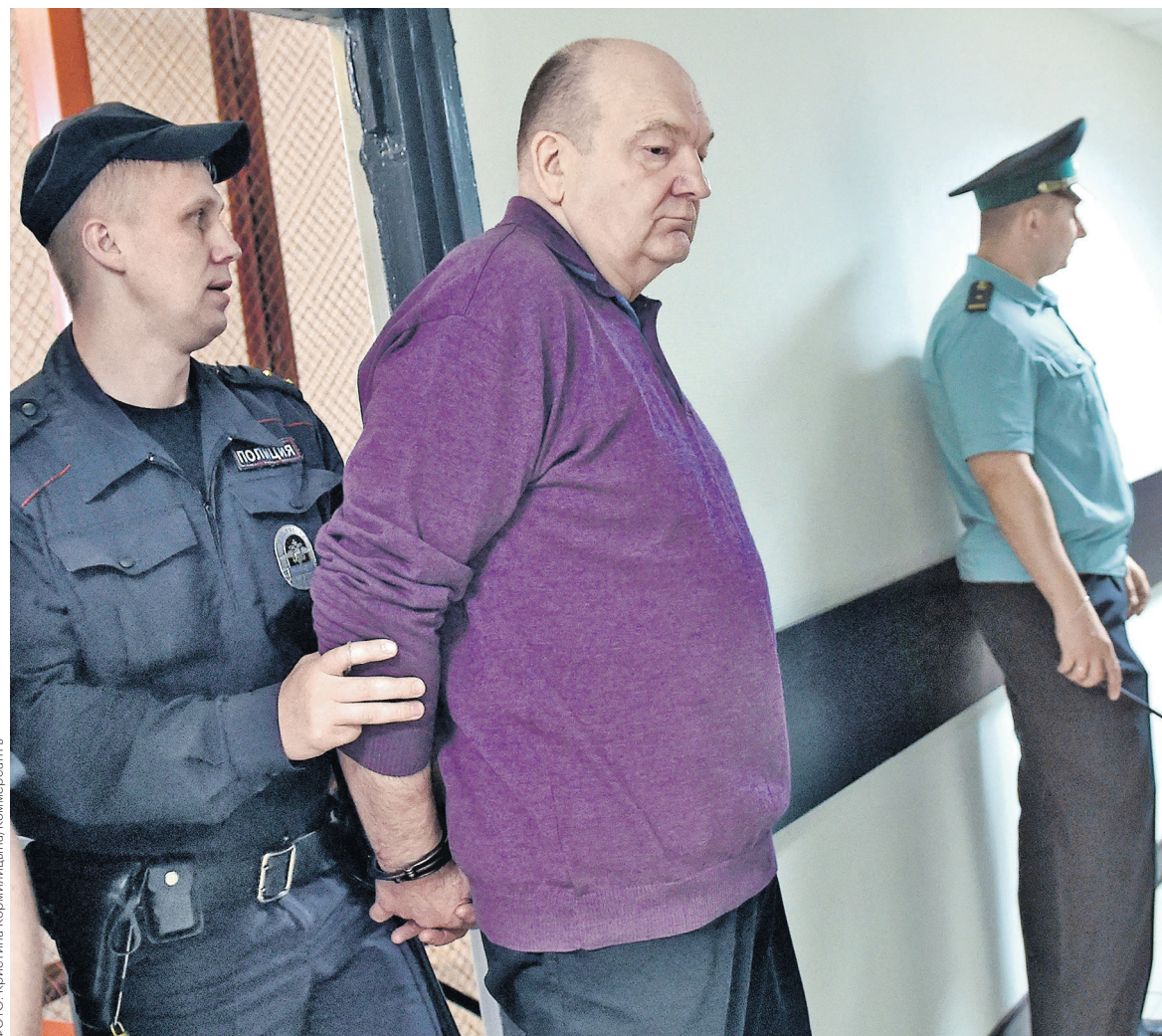
Как считает гособвинение, в результате действий Александра Реймера каждый электронный браслет обходился ФСИНу в 108–128 тыс. руб., хотя реальная стоимость не превышала 20 тыс. руб.