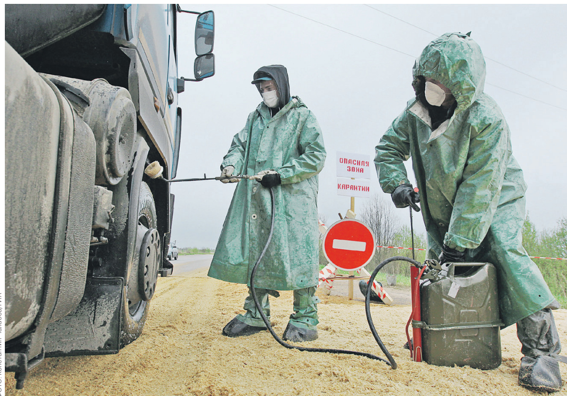
По данным Россельхознадзора, в 90% случаев АЧС регистрируется сначала в личных подсобных хозяйствах, а уже затем переносится на крупные предприятия

«Прямые убытки от африканской чумы свиней [составили] 5 млрд руб., косвенные можно считать по-разному, но от 50 до 70 [млрд руб.] от проста предприятий», — сказал в среду руководи-