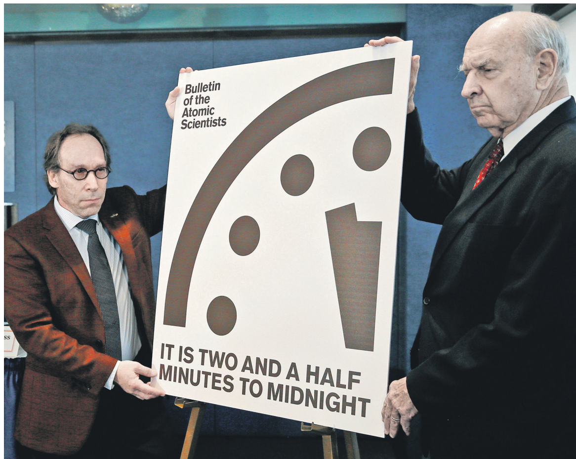
Ученые, участники проекта «Часы Судного дня», считают, что миру всерьез угрожает ядерная катастрофа. 26 января 2017 года они объявили, что до нее осталось 2,5 минуты. Причиной очередного движения стрелок к «полуночи» стало избрание Дональда Трампа президентом США

Расчет на то, что принятие новой конвенции побудит ядерные державы ускорить процесс ядерного разоружения, вряд ли сбывается, считает Михаил Ульянов, директор департамента по вопросам нераспространения и контроля над вооружениями Министерства иностранных дел России. «К реалистичному взгляду на ситуацию такой подход никакого отношения не имеет. Это романтические представления», — сказал он РБК.