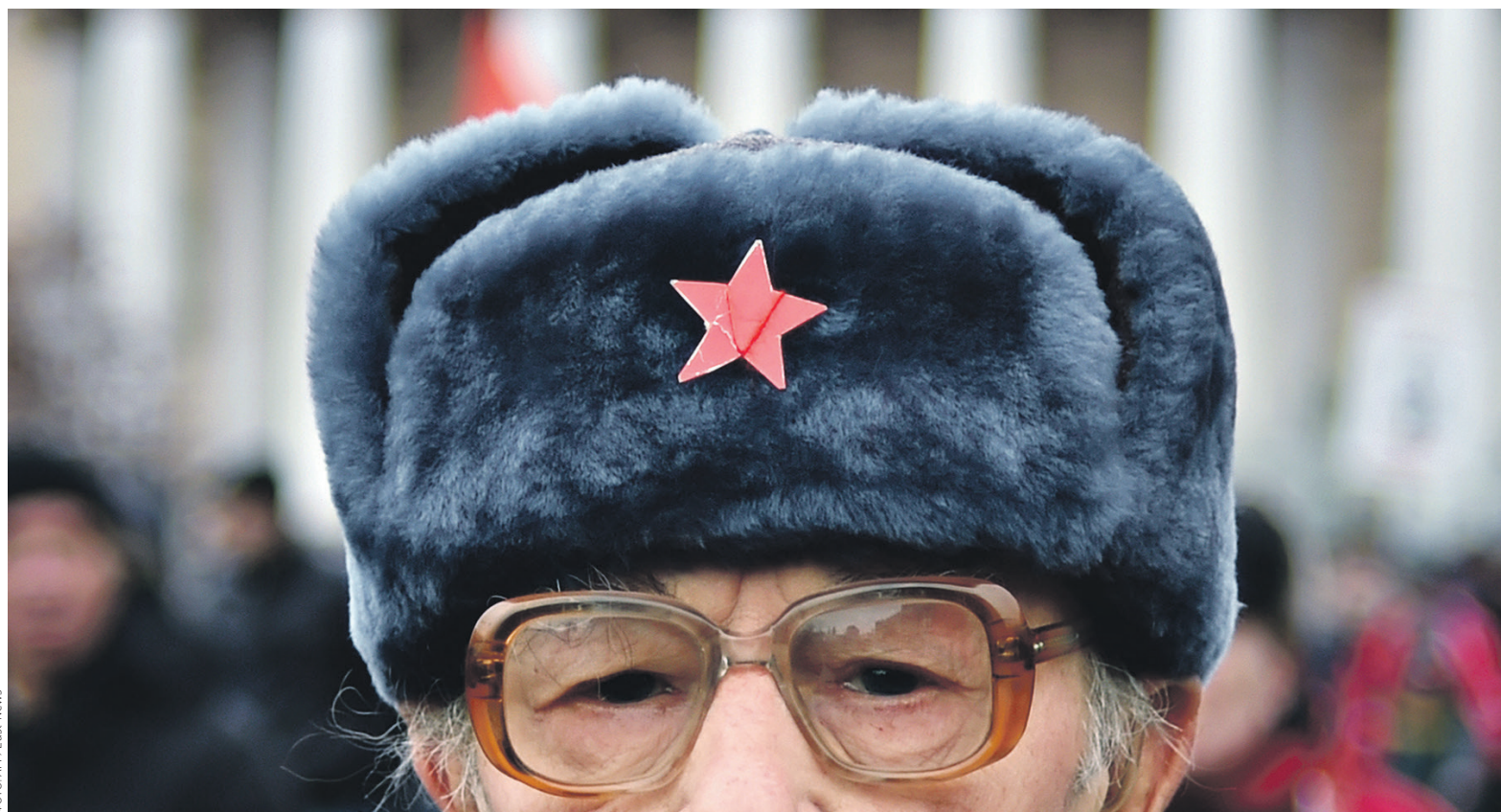
Военные пенсионеры получают пособия не от ПФР, а от своих силовых ведомств — Минобороны, МВД, ФСБ и тд, следует из закона о пенсионном обеспечении военных, их семей и приравненных к ним лиц