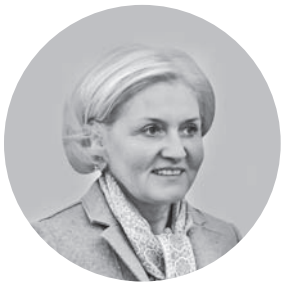
Ольга Голодец Заместитель Председателя Правительства Российской Федерации

В рамках конференции «Корпоративная социальная ответственность бизнеса: стратегии развития в России» Ассоциация менеджеров представила ежегодный рейтинг «ТОП-50 российских менеджеров по корпоративной социальной ответственности» . Рейтинг призван стать главным ориентиром качества управления в профессиональной среде менеджеров по КСО. Победителями являются лучшие из лучших российских управленцев, с именами которых связаны успехи компаний в области социальной ответственности и устойчивого развития.