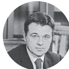
Андрей Воробьев губернатор Московской области

+7 (495) 363 11 11, bc@rbc.ru, bc.rbc.ru