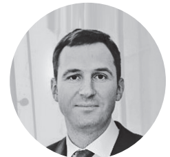
Денис Буцаев заместитель Председателя Правительства Московской области — министр инвестиций и инноваций Московской области