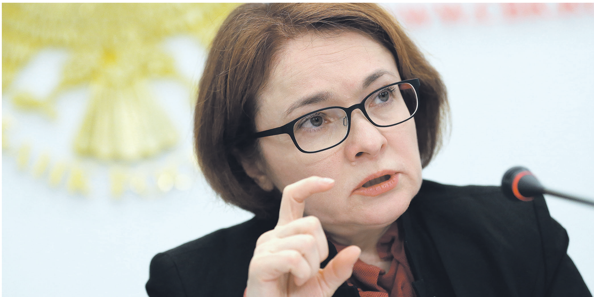
Регулятор отмечает, что значительный вклад в замедление темпов роста потребительских цен вносят временные факторы, а снижение инфляционных ожиданий остается неустойчивым. На фото: председатель Банка России Эльвира Набиуллина

Банк России сохранил ключевую ставку в размере 10%