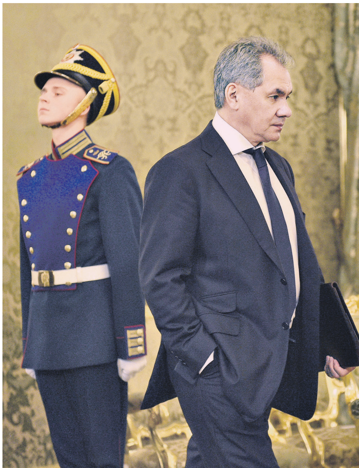
Единовременную выплату получают только те отставные военные, кто заработал после службы еще и гражданскую пенсию, а также те, кто вместо военной пенсии выбрал страховую, отмечают чиновники. На фото: министр обороны Сергей Шойгу

Проект бюджета 2017 года предусматривает увеличение финансирования по статье о