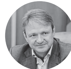
Александр Ткачев министр сельского хозяйства РФ