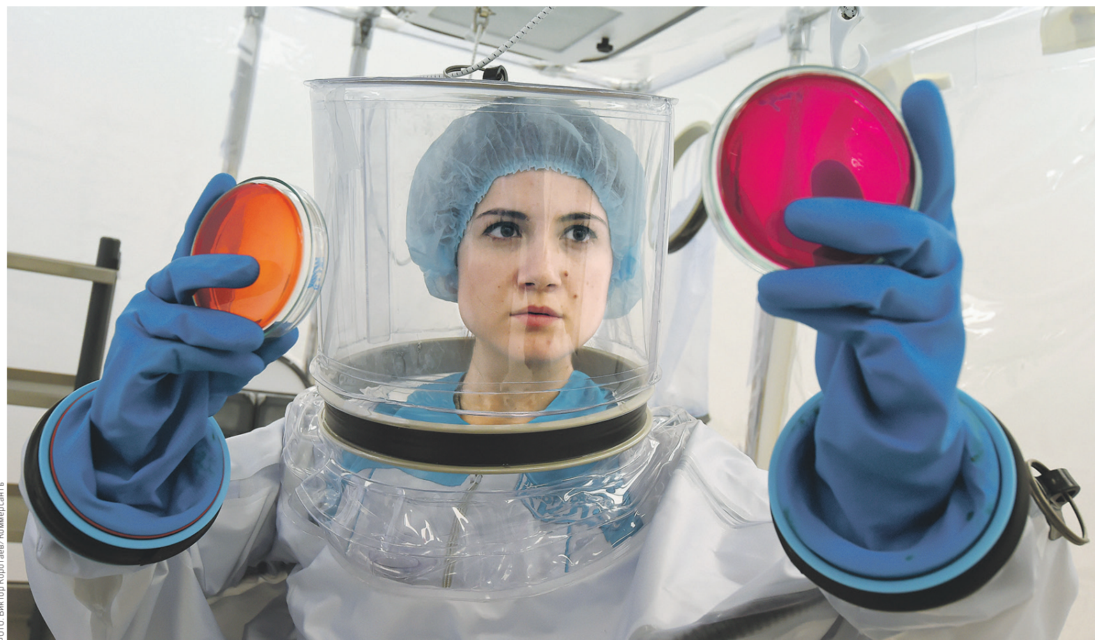
Введение запрета на свободное использование научных разработок в фармакологии было обязательным требованием для вступления России во Всемирную торговую организацию

Из-за того что создание оригинальных лекарств — куда более дорогостоящий и трудозатратный