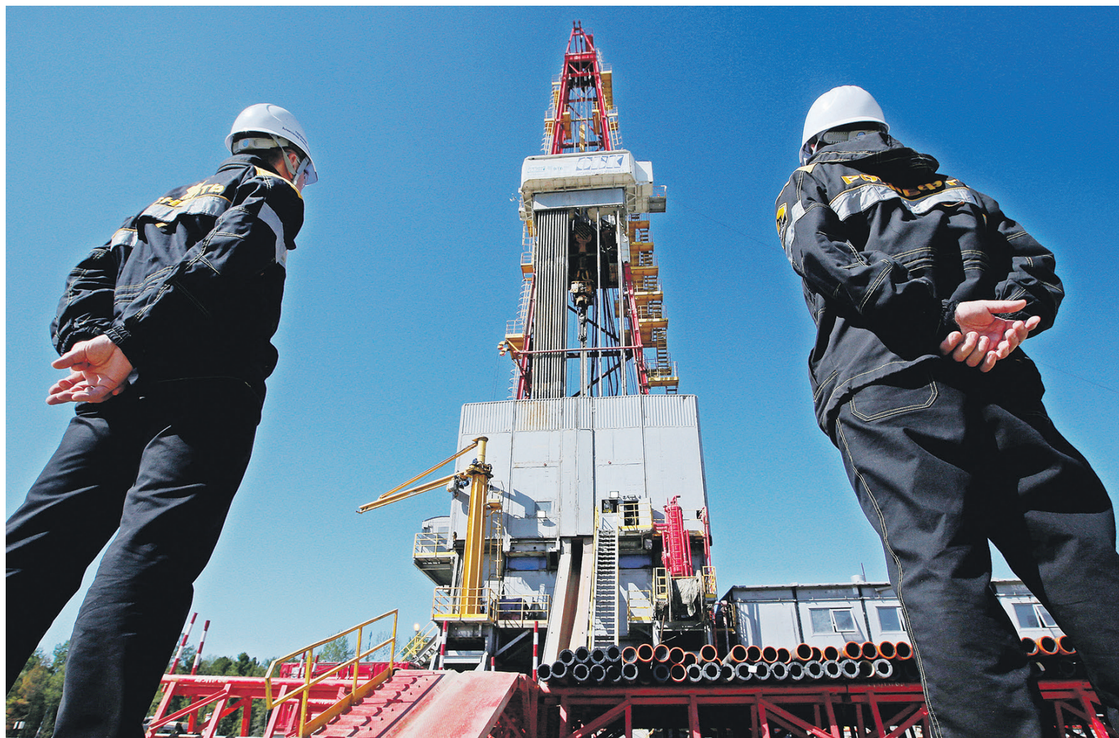
Заявка о покупке 100% может означать и покупку госкомпанией доли Башкирии в «Башнефти» (25,79% обыкновенных акций), и выставление оферты миноритариям компании (11,73%), сказал РБК источник, близкий к «Роснефти»

По распоряжению правительства 12 октября «Роснефть» купила у Росимущества 50,08% уставного капитала (60,16% обыкновенных акций) «Башнефти» за 329,6 млрд руб. Через несколько дней по-