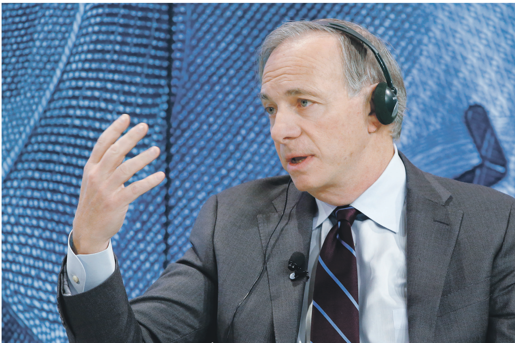
Личное состояние главы Bridgewater Рея Далио журнал Forbes оценивает в $15,9 млрд

Как Рей Далио создал крупнейший хедж-фонд мира