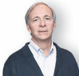
Рей Далио, инвестор