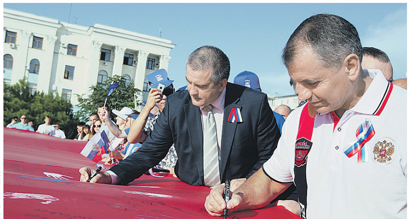
↑ В 2014 году 20-летие праздника отмечалось через несколько месяцев после присоединения Крыма к России. Власти полуострова приняли участие в праздновании. На фото слева глава Крыма Сергей Аксенов