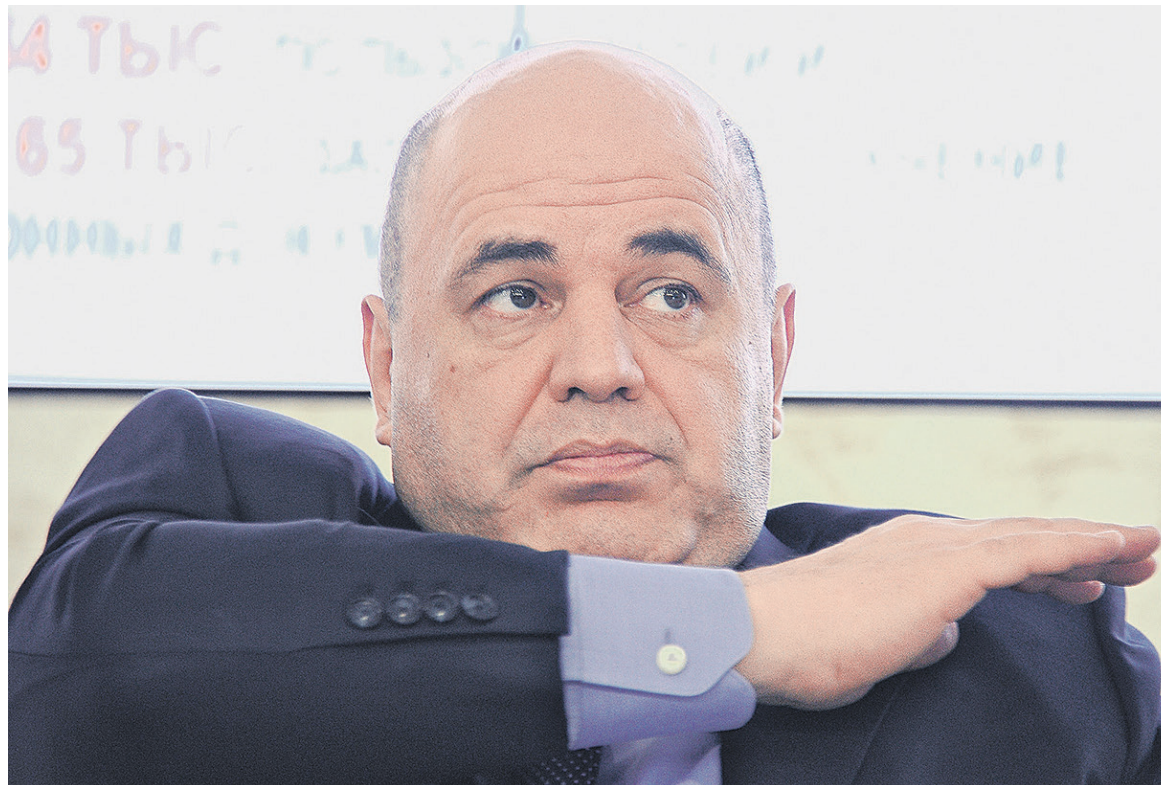
За первые семь месяцев 2016 года ФНС отказала в аккредитации 658 иностранным компаниям. На фото: глава ФНС Михаил Мишустин

За период с 1 января 2015 года по 1 августа 2016 года за первичной аккредитацией обратилось в общей сложности более 2,6 тыс. иностранных компаний, а число решений об отказе за этот период составило 216, говорится в ответе ФНС на запрос РБК. Таким образом, более 8% компаний, желающих начать работать в Рос-