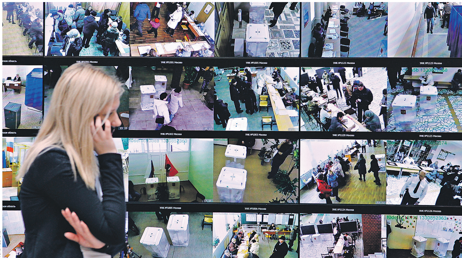
Пик наблюдательской активности пришелся на 2013 год. С тех пор интерес активистов к выборам снижается